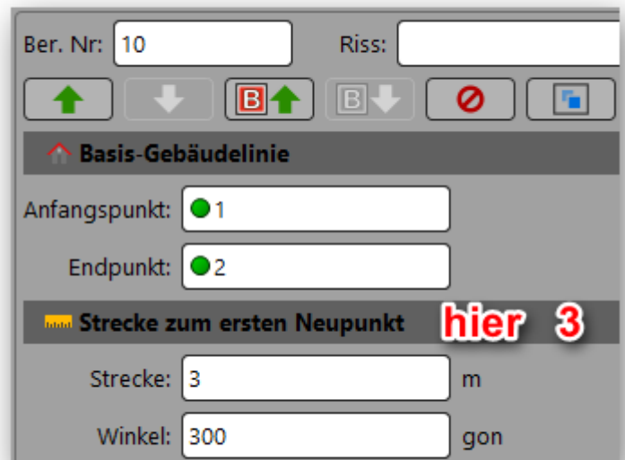
Abbildung 2: Basislinie